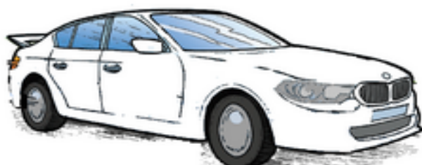
En blå BMW